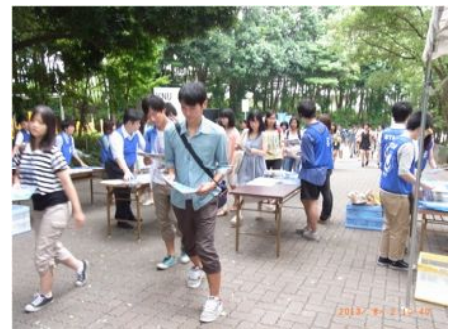
オープンキャンパス当日、シャトルバスに乗り込む見学者と受付の混雑