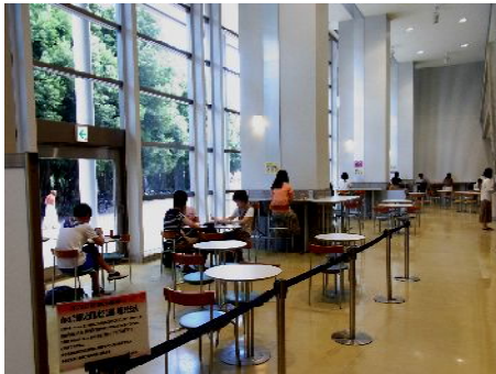
中央図書館 1 階のカフェテリア