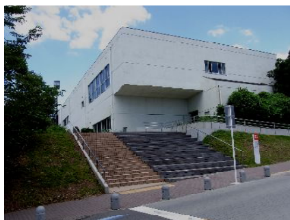
常盤台キャンパスの風景

黒川 えーっ、すると入学させる学生の数を減らすだけでなく、それに伴って先生方の数も減らすということですか。考えてみれば、そうなりますね。しかし当時は国大の先生方は国家公務員ですから身分を保障されているので、一方的に減首と言うわけにはいかないでしょう。民間の会社だったらストが起こりますね。