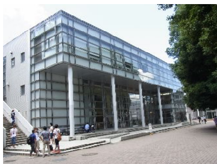
常盤台 国大図書館

には、その課程の学生数の枠を直ちに「教育課程専攻」の学生枠に振り替えるという含みが、文部省にはあったようです。『あゆみ』の P.953 に各年度ごとの卒業生数の表が載っていますが、ゼロ免課程の学生が始めて卒業した 1992(平成 4)年の教育学部の卒業生の数は 533 名(そのうち教員養成課程 393 名)に対して、その前年の 1991(平成 3)年の卒業生数は 516 名と、教育学部卒業生の数はほとんど変化していません。つまり児童・生徒数が増加した場合には、ゼロ免課程の学生を教員養成課程に切り替えるだけで簡単に