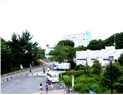
常盤台キャンパスの風景

師範学校以来の伝統を受け継いで教員養成に力を注ごうという考えで、文理派は学問研究に力を注ぎ、将来的には文理学部を志向しようという考えでした。この文理派の人達の多くが、学部名変更は師範教育の復活を目指すものだと強硬に反対したのです。