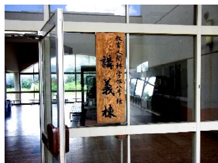
教育人間科学部講義棟

平出 この学部長私案を受けて、11月1日の学部改革委員会では学生入学定員の他学部への振り替えと、それに連動させてしかるべき人数の教官を他学部へ移籍することの可能性やその規模を検討しました。そして教育学部教官全員を対象とした「他学部への移籍(配置換え)に関する意向調べ」を実施しました。