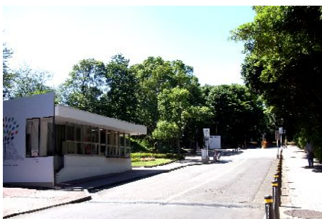
常盤台キャンパスの正門付近

黒 川 あともう一つ友松会の方から聞いた話では、教員養成を各県一つの国立大学で行わずに、たとえば首都圏では東京・神奈川・千葉というように広域的にまとめて一つの大学で行なうという考えが文部省であったということですが。