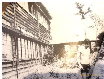
国大時代の蒼翠寮

司会 では寝たい時に寝て、起きたい時に起きるというわけですか。師範時代に寄宿舎生活を送った人から見ると、なんと羨ましいと言うか、なんとだらしがないと言うか、どちらでしょうね。で、ラッパはなかった