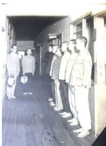
師範時代の寄宿舎の夜の点呼