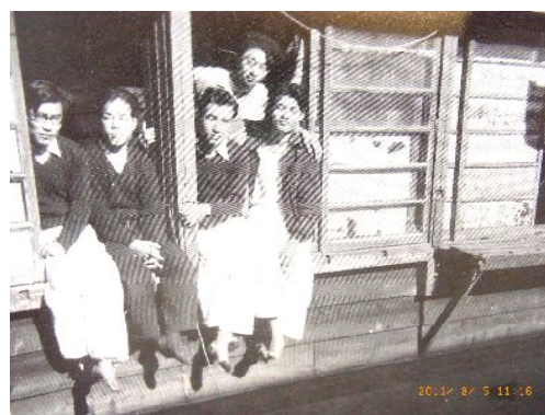
窓辺に依る国大時代の寮生