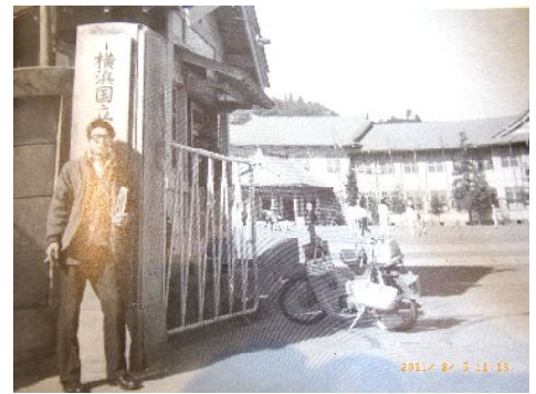
国大鎌倉時代の正門

司会 いや民研にも、そういうカップルは何組もいますよ。当時は若い男女が知り合う機会は今ほど多くありませんでしたからね。