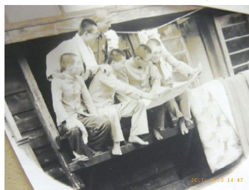
窓辺に依る師範時代の寮生

小 野 庶務では、家から送ってくる為替を受け取ってその学生に渡すなどの仕事もしました。アルバイト対策委員会では、学生にアルバイトの斡旋をしましたが松竹大船撮影所の地元なので、エキストラの仕事もあったね。